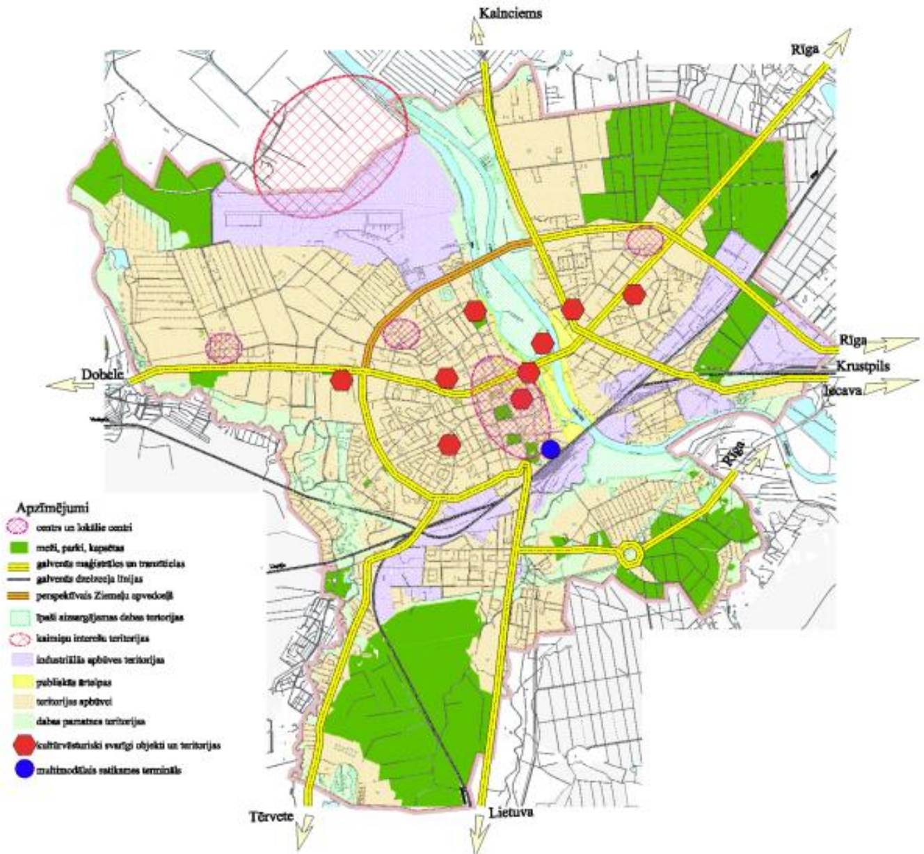
2.attēls Jelgavas pilsētas telpiskās attīstības perspektīva

Jānodrošina pilsētas un lauku pašvaldību sadarbība izglītības, veselības aprūpes, uzņēmējdarbības, t.sk. tūrisma, attīstības un vides aizsardzības jautājumos. Ražošanas un uzņēmējdarbības nodrošināšanai tiek veidotas kopīgas industriālas teritorijas ar kaimiņu pašvaldībām, izmantojot pierobežu zemes.