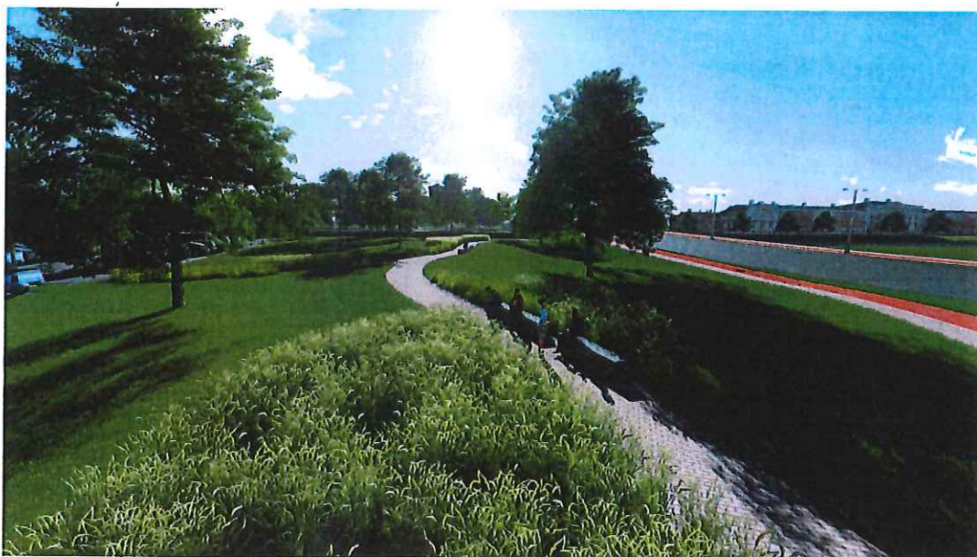
2.Attēls. Priekšlikums apakšzonas P4 attīstībai

Jaunu objektu izvietojums lokālpilnoījuma teritorijā nedrīkst aizsegt pilsētas centra siluetu un tam jārespektē pilsētībūvnieciskā objekta – pils atrašanās iepretim teritorijai (Sk. Pielikumu Nr.1). Teritorijas Krasta ielā 1 atļautā izmantošana tiek noteikta divās apakšzonās – Publiskā apbūve P1 un P4 (Sk.Karti „Funkcionālais zonējums”). Apakšzonā P4 galvenā atļautā izmantošana ir publiskā ārtelpa un ar to saistītās infrastruktūras izbūve. Teritorija labiekārtojama, tajā atļauts izvietot mazās arhitektūras formas.