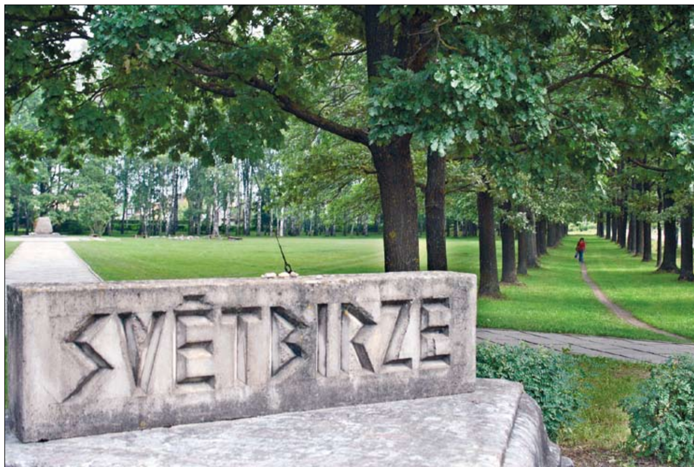
Svētakmens vietu nemainīs, taču topošās memoriālās sienas kompozicionāli tiks izvietotas pie ieejas Svētbirzē – Vecā un Kalnciema ceļa krustojumā.