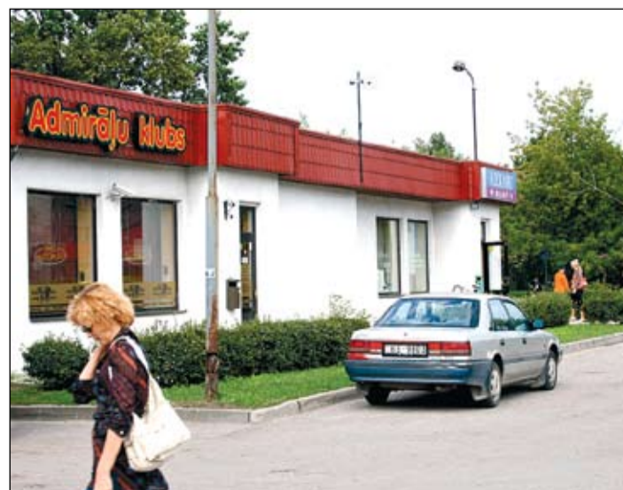
«Admirāļu klubs» savu īpašumu pašā pilsētas centrā gribēja pārdot sev tuvam uzņēmumam par 66 000 latu, lai gan tā tirgus vērtība ir ap 200 000 latu.