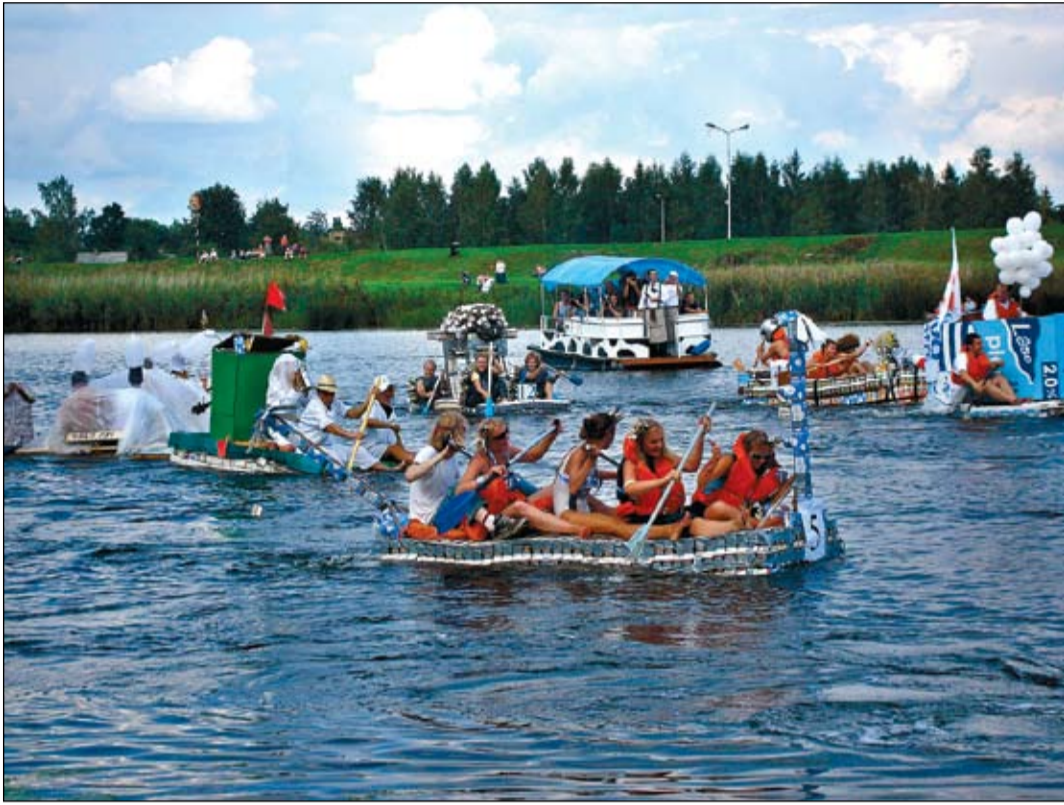
25. augustā pulksten 15 Pasta salā tiks dots starts 5. Piena paku laivu regatei. Pagājušajā gadā šis pasākums sapulcinājis 15 laivas, un organizatori cer, ka šogad Lielupes ūdeņos būs daudz vairāk peldlīdzekļu.

Lai nevienam no apmeklētājiem nemocītos vēdergrāzēs no pārēšanās, visus izkustēties aicinās mazie «Vēja zirdziņi» – «piena ķilķeni un