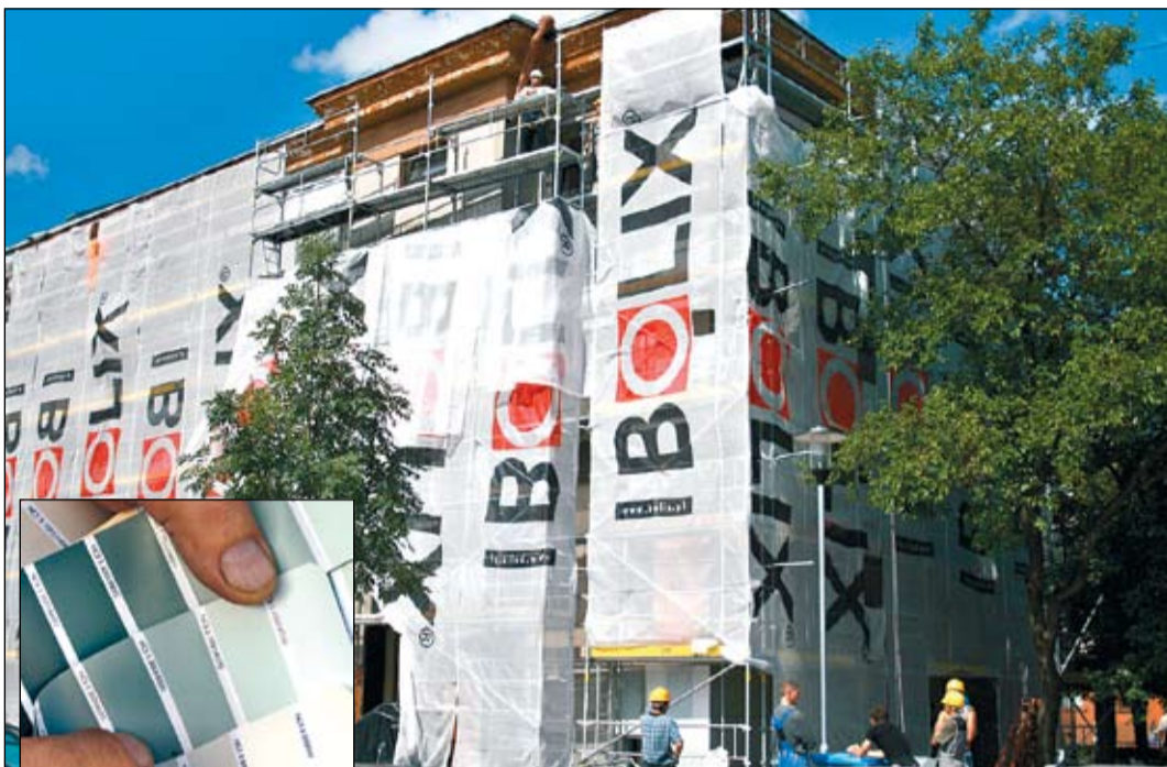
Pēc fasādes remonta Jelgavas domes ēka iegūs citu krāsu – izšķiršanās vēl notiek starp diviem dažādas intensitātes sidrabaini pelēkajiem toņiem.