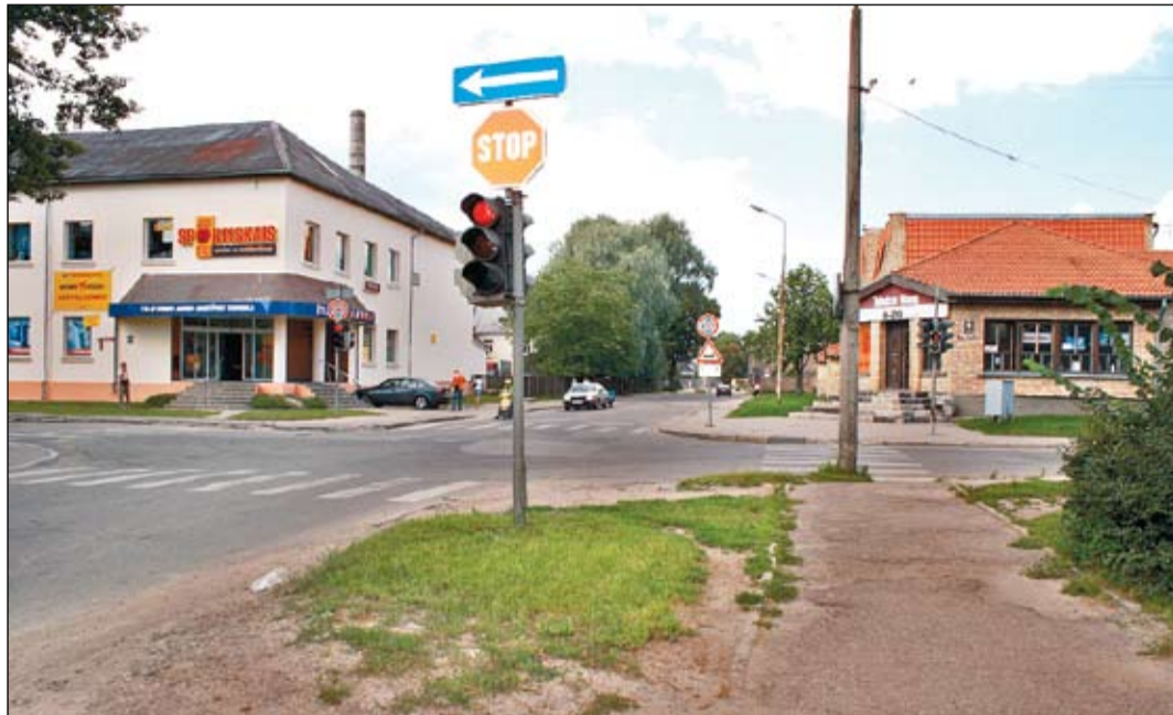
Jelgavā palikuši vien divi novecojušie padomju laika luksofora objekti – viens no tiem atrodas Pulkveža Brieža un Dobeles ielas krustojumā. Pašvaldības aģentūra «Pilsēt-saimniecība» spriež, ka tā nomaīņu varētu veikt līdz nākamā gada rudenim.