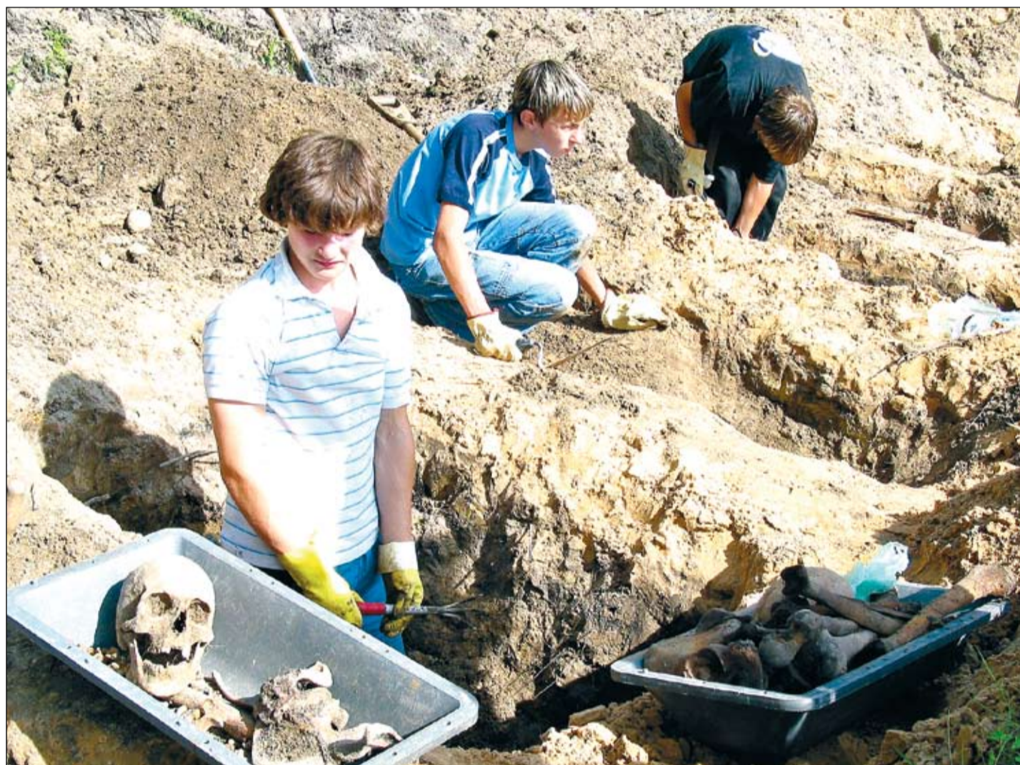
Jau kopš pagājušās nedēļas posmā no «Latvijas keramikas» uz Ozolnieku pusi ceļa malā notiek Otrā pasaules kara vācu karavīru kapa vietu atrakšana, kas uzietas veloceļa izbūves laikā. Karavīri tiks pārapbedīti Miera kapos.

Atrokot kapa vietas, uziet, ka tās gar šosejas malu izvietotas divās līnijās, katrā apbedīti vismaz ap 30 vācu karavīru, atrastas arī divu leģionāru mirstīgās atliekas. «Ļoti svarīgi, ka, veicot kapu atrakšanu, mēs atrodam dažādas karavīru personīgās mantas, kas noteikti būs pavediens, lai palīdzētu noteikt kritušo identitāti,» spriež