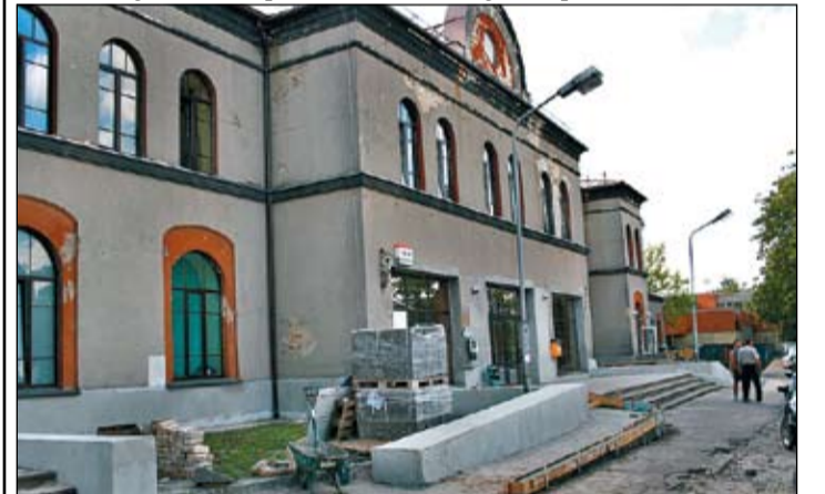
Pamazām dzelzceļa stacija «Jelgava» kļūst pasažieriem tīkamāka. Veicot kapitālo remontu, pārbūvētas komunikācijas, ēka nosiltināta un veikti citi būtiski remontdarbi. Drīzumā sāksies arī fasādes renovācija.