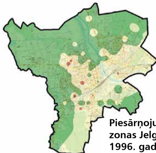
Piesārņojuma zonas Jelgavā, 1996. gads

Pētījuma metodika ir salīdzinoši vienkārša: kopš 1996. gada Jelgavas teritorija ir sadalīta parauglaukumos: pilsētas centra teritorija – 500x500 metru laukums, bet pārējā – viena kvadrātkilometra