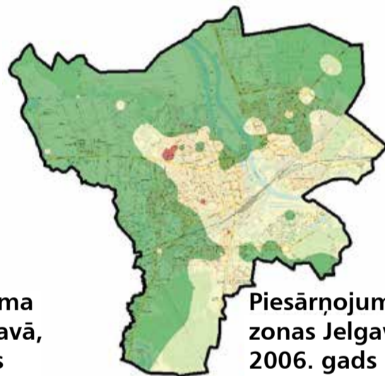
Piesārņojuma zonas Jelgavā, 2006. gads

augsta piesārņojuma zona jeb stipri ierobežota ķērpju apdzīvotība