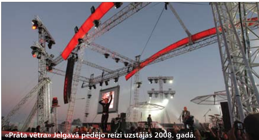
«Prāta vētra» Jelgavā pēdējo reizi uzstājās 2008. gadā.