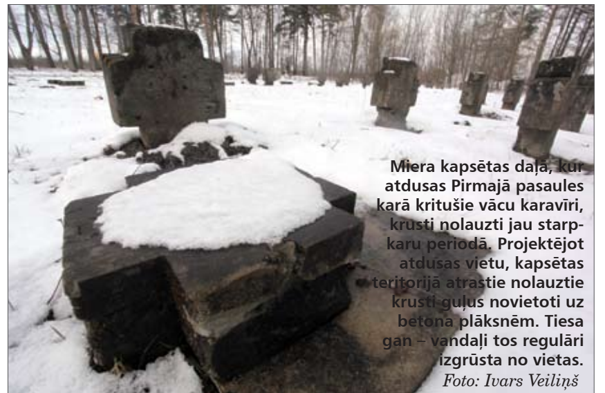
Miera kapsētas daļa, kur atdusas Pirmajā pasaules karā kritušie vācu karavīri, krusti nolauzti jau starpkaru periodā. Projektējot atdusas vietu, kapsētas teritorijā atrastie nolauztie krusti guļus novietoti uz betona plāksnēm. Tiesa gan – vandāļi tos regulāri izgrūsta no vietas.