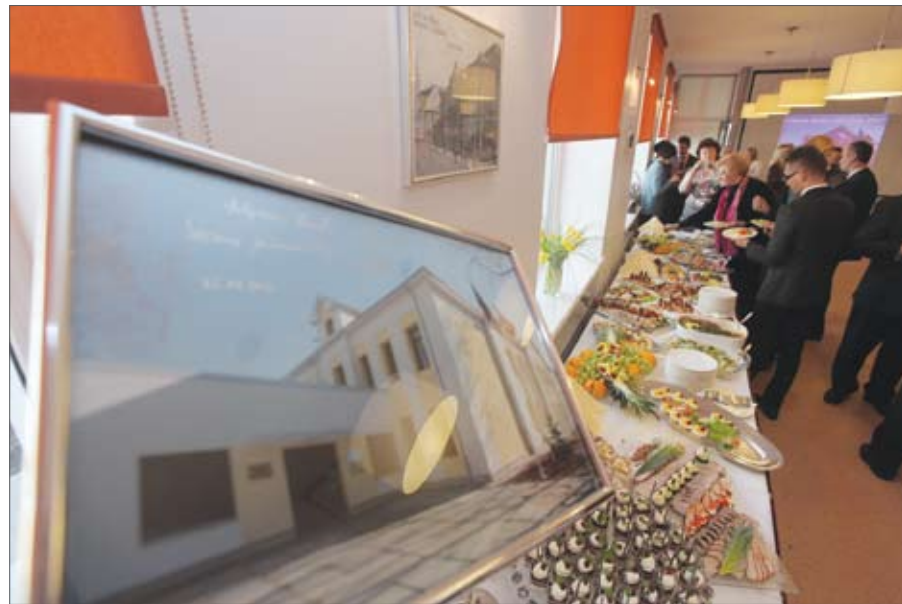
Jaunā Jelgavas Amatu vidusskolas degustāciju zāle ir pārtikas programmās studējošo laboratorija, kurā audzēkņi gan mācās gatavot, gan apgūst galda kultūru.