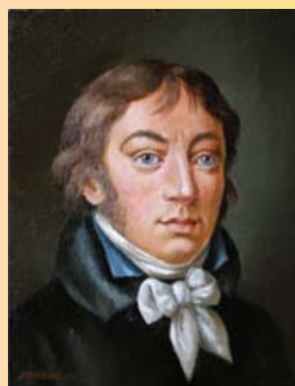
Attēls: Kārlis Fridrihs Vatsons

Latvijas nacionālās periodikas vēstures sākums pamatoti saistīts ar Jelgavu – 1822. gada 5. janvārī mūsu pilsētā latviešu valodā iznāca pirmais laikraksts «Latviešu Avīze» numurs. Laikrakstu izdeva 93 gadu garumā, līdz 1915. gada aprīlim. Avīzes idejas autors bija Lestenes mācītājs Kārlis Fridrihs Vatsons (1777 – 1826). Viņš uzskatīja, ka avīze var kļūt par dzimtbūšanas atcelšanas reformas īstenošanas palīgu un padomdevēju.