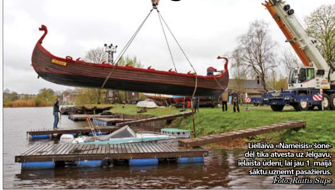
Liellaiva «Nameisis» šonedēļ tika atvesta uz Jelgavu, ielaista ūdenī, lai jau 1. maijā sāktu uzņemt pasažierus.