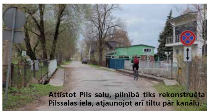
Attīstot Pils salu, pilnībā tiks rekonstruēta Pilssalas iela, atjaunojot arī tiltu pār kanālu.

Airēšanas bāze, kas celta 1970. gadā, ir morāli un tehniski novecojusi – gērbtuves un palīgtelpas ir mazas un nav apsildāmas, kas liedz trenēties ziemā, trenāžieru zāle neatbilst prasībām, ēkā nav sanitārā mezgla un dušas telpas. Pašvaldība paredz, ka līdz ar jaunās bāzes izveidi tajā treniņus aizvadis ūdens sporta veidu sportisti, bet sacensībās būs iespēja uzņemt līdz pat 400 dalībnieku.