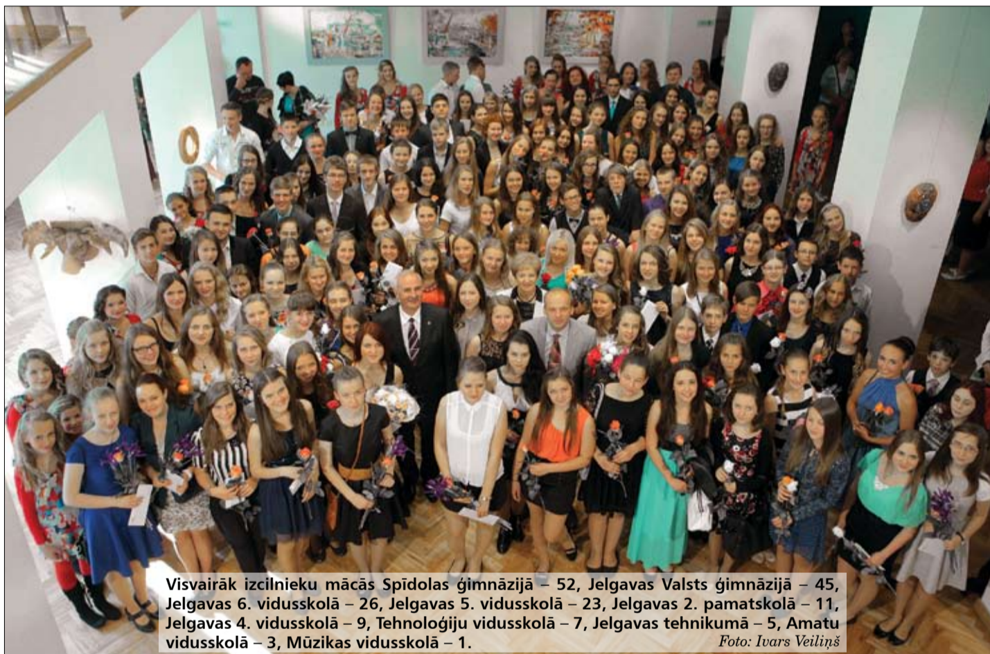
Visvairāk izcilnieku mācās Spīdolas ģimnāzijā – 52, Jelgavas Valsts ģimnāzijā – 45, Jelgavas 6. vidusskolā – 26, Jelgavas 5. vidusskolā – 23, Jelgavas 2. pamatskolā – 11, Jelgavas 4. vidusskolā – 9, Tehnoloģiju vidusskolā – 7, Jelgavas tehnikumā – 5, Amatu vidusskolā – 3, Mūzikas vidusskolā – 1.