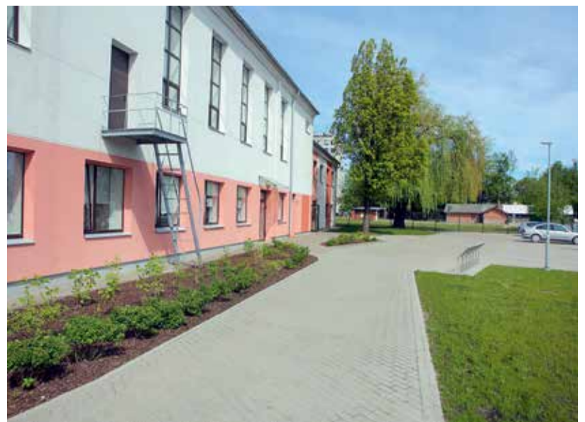
Ar Eiropas Reģionālās attīstības fonda atbalstu labiekārtota teritorija pie abām skolas ēkām – Akadēmijas ielā 25 un Elektriības ielā 8. Ēku pagalmā ieklāts bruģis, izveidotas autostāvvietas, velonovietnes, kā arī teritorija apzaļumota, iestādīt košumkrūmus un puķes. Tāpat ap abām ēkām atjaunots žogs.

Kopējās projekta plānotās izmaksas ir 5 003 648,97 eiro, tostarp Eiropas Reģionālās attīstības fonda finansējums 3 110 950,70 eiro, valsts budžeta dotācija pašvaldībām 128 875,72 eiro un Jelgavas pašvaldības finansējums 1 763 822,55 eiro. Visiem projektā iecerētajiem darbiem jābūt pabeigtiem un jaunajām iekārtām piegādātām līdz šā gada 31. decembrim.