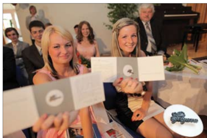
Piemiņas nozīmīti ar Jelgavas logotipu, kas stilizēti atveido pilsētas nosaukumu, izlaidumā šonedēļ saņēma arī 40 Jelgavas 4. vidusskolas absolventi.

Ar šo gadu izlaidumos ieviesta jauna tradīcija – lai stiprinātu jauniešu piederības sajūtu Jelgavai, vidusskolu absolventi no pilsētas