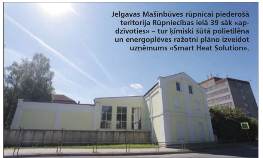
Jelgavas Mašīnbūves rūpnīcai piederošā teritorija Rūpniecības ielā 39 sāk «apdzīvoties» – tur ķīmiski šūtā polietilēna un energopļēves ražotni plāno izveidot uzņēmums «Smart Heat Solution».

Parka īpašnieks P.Bila norāda, ka kompleksā kopumā ir 20 000 kvadrātmetri