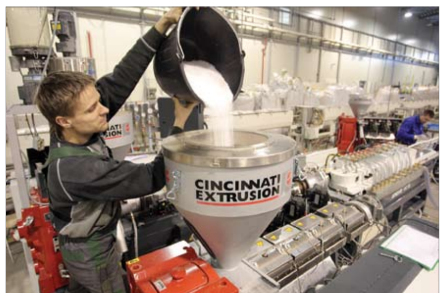
Plastmasas cauruļu ražotne «Evopipes» 2010. gadā investēja 1,5 miljonus latu jaunā ražošanas līnijā. Nu uzņēmums plāno paplašināt noliktavu.

telpu, kuras tiek iznomātas, un interese par tām ir vairākiem uzņēmumiem.