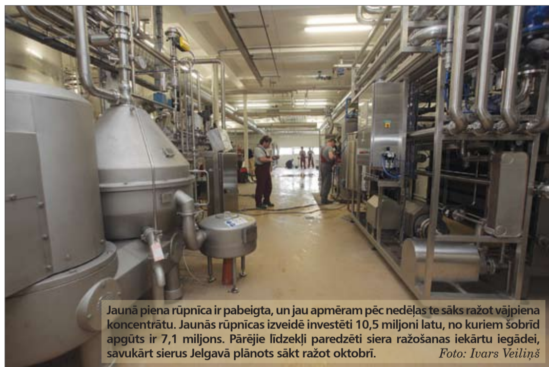
Jaunā piena rūpnīca ir pabeigta, un jau apmēram pēc nedēļas te sāks ražot vājpiena koncentrātu. Jaunās rūpnīcas izveidē investēti 10,5 miljoni latu, no kuriem šobrīd apgūti ir 7,1 miljons. Pārējie līdzekļi paredzēti siera ražošanas iekārtu iegādei, savukārt sierus Jelgavā plānots sākt ražot oktobrī.