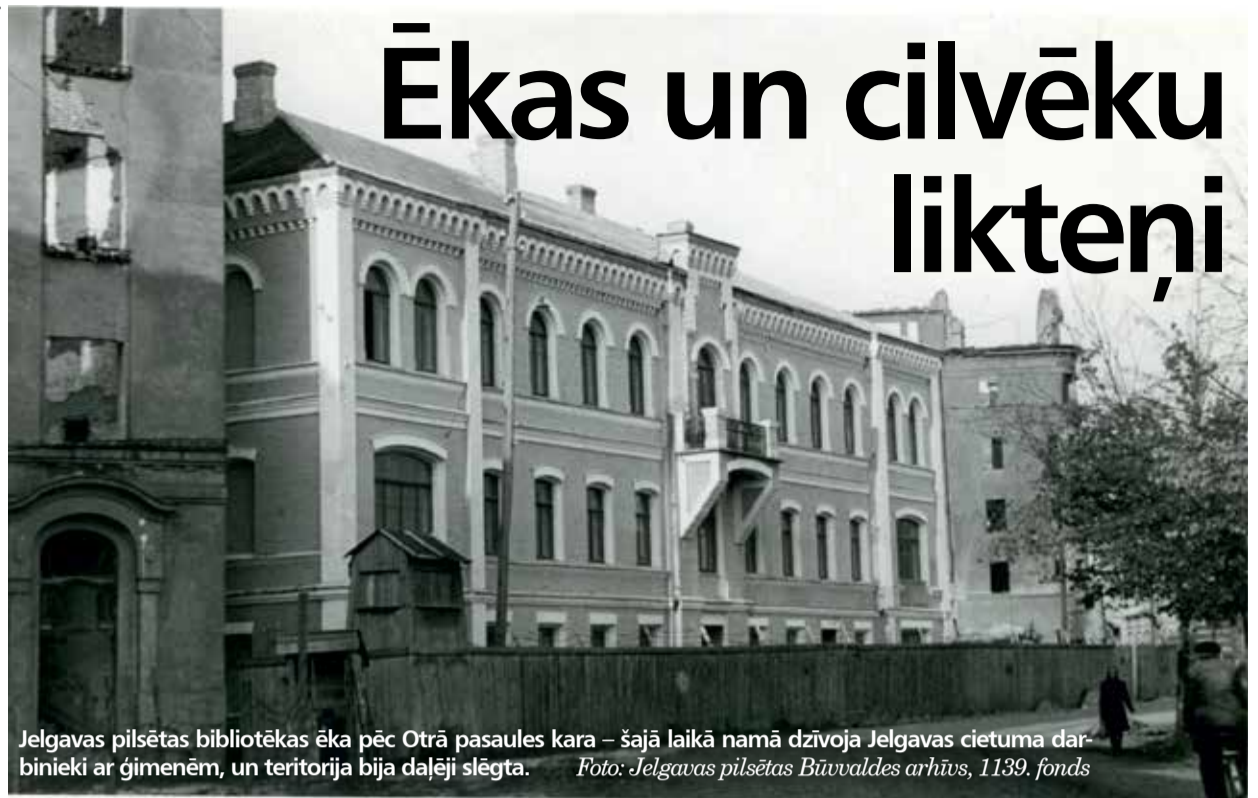
Jelgavas pilsētas bibliotēkas ēka pēc Otrā pasaules kara – šajā laikā namā dzīvoja Jelgavas cietuma darbinieki ar ģimenēm, un teritorija bija daļēji slēgta.