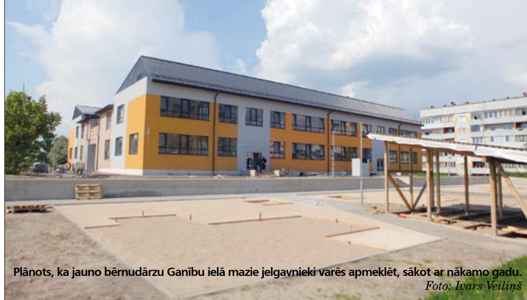
Plānots, ka jauno bērnodārzu Ganību ielā mazie jelgavnieki varēs apmeklēt, sākot ar nākamo gadu.