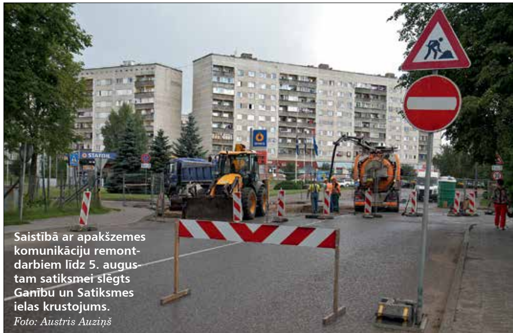
Saistībā ar apakšzemes komunikāciju remontdarbiem līdz 5. augustam satiksmei slēgts Ganību un Satiksmes ielas krustojums.