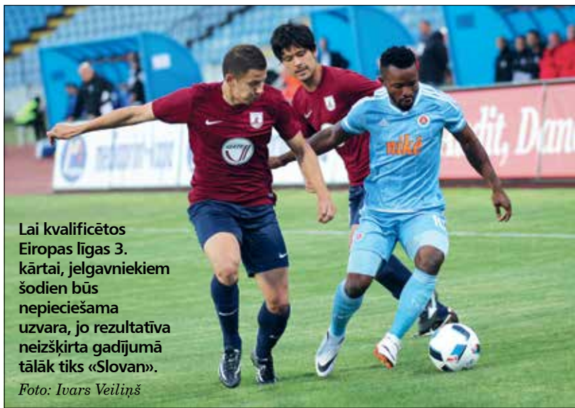
Lai kvalificētos Eiropas līgas 3. kārtai, jelgavniekiem šodien būs nepieciešama uzvara, jo rezultatīva neizšķirta gadījumā tālāk tiks «Slovan».

Tieši pirms nedēļas – 14. jūlijā – FK «Jelgava» aizvadīja Eiropas līgas 2. kvalifikācijas kārtas izbraukuma spēli futbolā pret Bratislavas «Slovan». Lai gan bumbas kontroles ziņā ievērojams pārsvars bija «Slovan» futbolistiem, jelgavnieki prata nosargāt bezvārtu neizšķirtu, kas saglabā labas iespējas šodien savu līdzjutēju priekšā pacīnīties par uzvaru divu spēļu summā. Spēles sākums – pulksten 18.30.