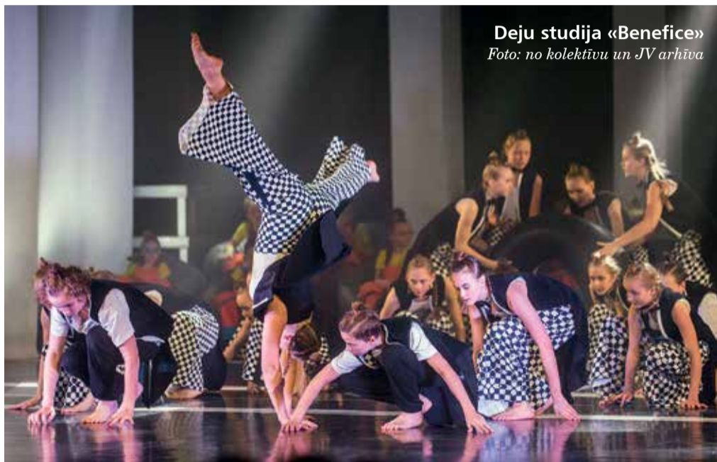
Deju studija «Benefice»