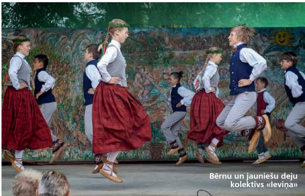
Bērnu un jauniešu deju kolektīvs «Ieviņa»