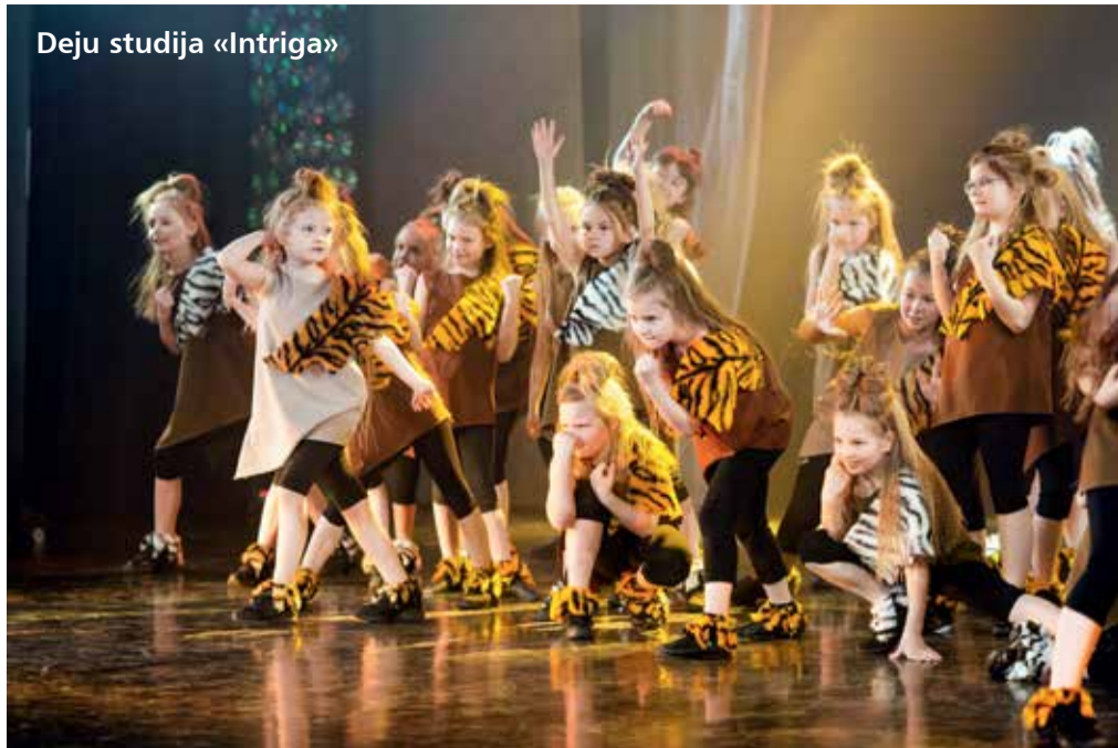
Deju studija «Intriga»