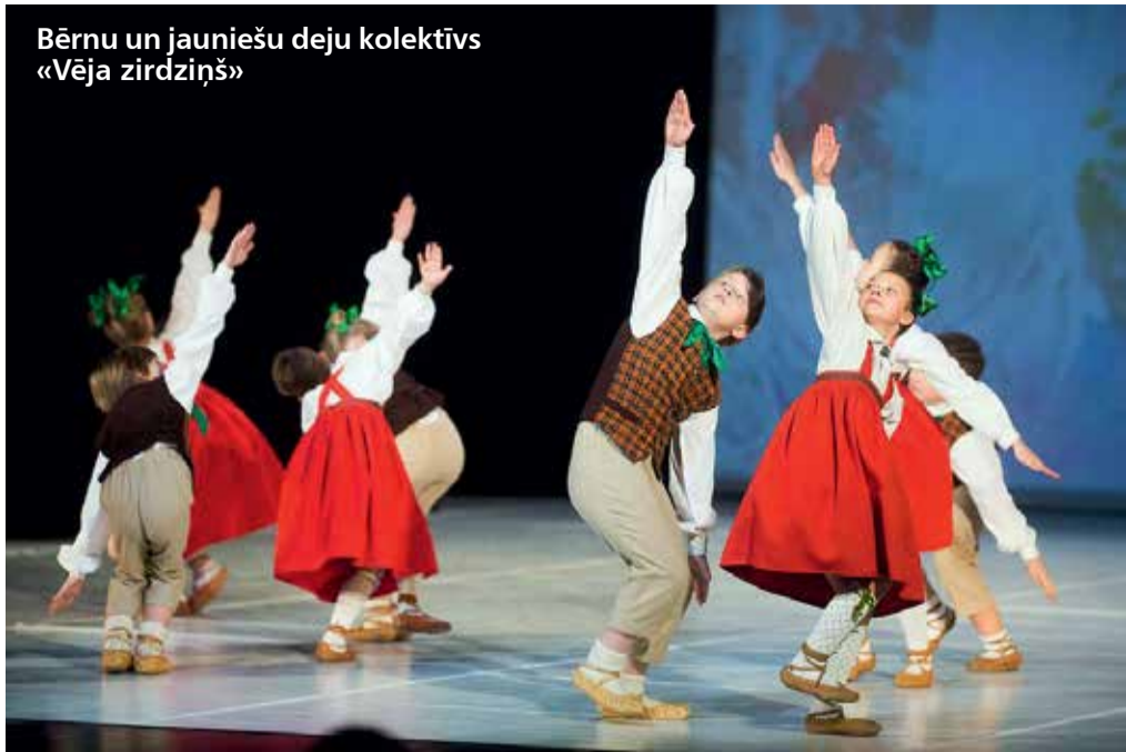
Bērnu un jauniešu deju kolektīvs «Vēja zirdziņš»