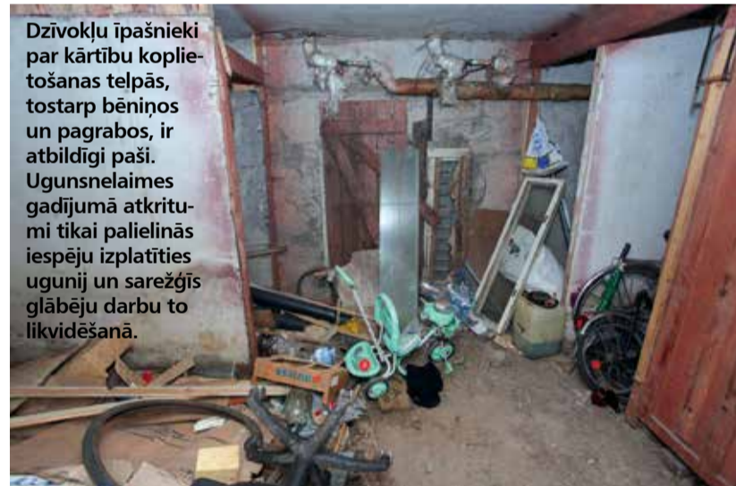
Dzīvokļu īpašnieki par kārtību koplietošanas telpās, tostarp bēniņos un pagrabos, ir atbildīgi paši. Ugunsnelaimes gadījumā atkritumi tikai palielinās iespēju izplatīties ugunij un sarežģīs glābēju darbu to likvidēšanā.

Pārbaudes Jelgavas daudzdzīvokļu mājās turpināsies līdz 15. septembrim.