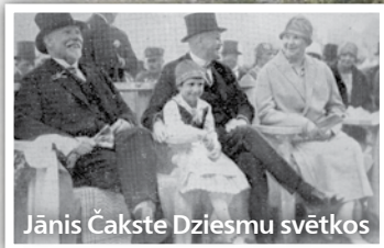
Jānis Čakste Dziesmu svētkos