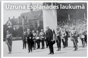
Uzruna Esplanādes laukumā