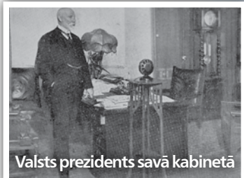
Valsts prezidents savā kabinetā