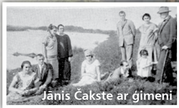
Jānis Čakste ar ģimeni