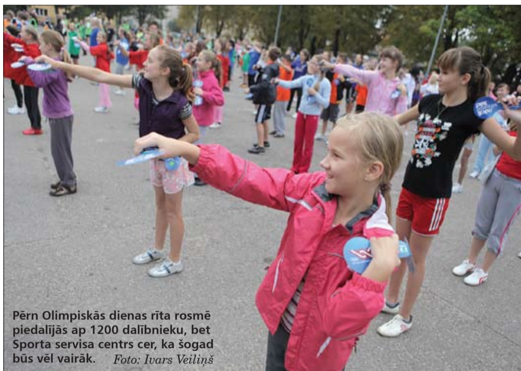
Pērn Olimpiskās dienas rīta rosmē piedalījās ap 1200 dalībnieku, bet Sporta servisa centrs cer, ka šogad būs vēl vairāk.

Rīt, 28. septembrī, visā Latvijā tiks atzīmēta Olimpiskā diena. Īpaša pasākumu programma sarūpēta arī Jelgavā – diena iesāksies pulksten 9.45 ar kopīgu rīta rosmi pie Zemgales Olimpiskā centra (ZOC), kur notiks arī pārējās aktivitātes.