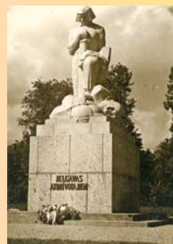
Attēls: K.Jansona veidots pieminēklis «Lāčplēsis un Melnais bruņinieks» (1932)

divu mēnešu periodu labprātīgai nodokļu saistību izpildes sakārtošanai un pārkāpumu novēršanai. Un tikai tad, ja VID sniegtā iespēja netiek izmantota, tiek uzsākti kontroles pasākumi. Kā pirmie tika kontrolēti autoser visi, pēc tam – zobārstniecības, bet marta vidū divu mēnešu periods labprātīgai nodokļu saistību izpildes sakārtošanai un pārkāpumu novēršanai tika noteikts skaistumkopšanas nozarei, kurā šobrīd notiek VID pārbaudes.