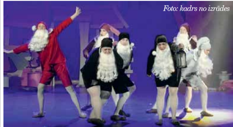
Foto: kadrs no izrādes

nes skaistums. Pamāte pavēl medniekam no Sniegbaltītes atbrīvoties, taču viņš to neizdara, un princese nonāk pie septiņiem rūķīšiem. Vēlāk, pamātei pašai cenšoties īstenot savu plānu, meitene apēd saindētu ābolu, un tikai īstas mīlestības skūpstis atgriez viņu pie dzīvības. Teju stundu garo izrādi papildina muzikāli priekšnesumi, dejas, kā arī īpašs sveiciens bērniem no paša Ziemassvētku vecīša. Jāpiebilst, ka līdztekus iespējai vērot izrādi ar skolu un bērnudārzu starpniecību pie bērniem nogādātas arī dāvanu paciņas. To saņemšanu katra izglītības iestāde organizē individuāli.