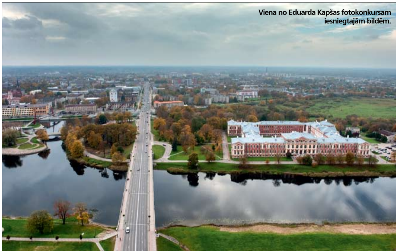
Viena no Eduarda Kapšas fotokonkursam iesniegtajām bildēm.