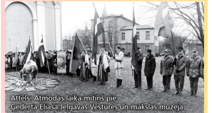
Attēls: Atmodas laika mītiņš pie Ģederta Eliasa Jelgavas Vēstures un mākslas muzeja

Jelgavā tautas atmodas laiks simboliski noslēdzās ar Ļeņinam veltītā pieminēklā demontāžu 1990. gada 17. oktobrī un atjaunotā pieminēklā Jelgavas atbrīvotājiem atklāšanu 1992. gada 21. novembrī Stacijas laukumā.