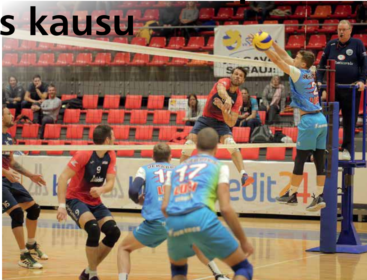
Ja vīriešu volejbola komanda «Biolars/Jelgava» iekļūs Latvijas kausa izcīņas pusfinālā, mūsējo pretinieki būs pērnā gada valsts čempioni «Jēkabpils lūši». Šosezon abas komandas vienreiz jau tikušas – «Credit24» Meistarlīgas ietvaros –, un tad trīs setos uzvaru izcīnīja jēkabpilieši.

Sāksies cīņa par Latvijas kausu volejbolā. Tajā jau ir iesaistījušās mūsu volejbolistes no VK «Jelgava/LLU», kuras pirmo spēli aizvadīja trešdienas vakarā, kad laikraksts «Jelgavas Vestnesis» jau bija nodots tipogrāfijā. Savukārt vīriešu komanda «Biolars/Jelgava» sacensību par kausu sāks pēc divām nedēļām.