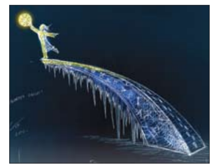
«Pieskarties saulei» – Kārļa Īles skulptūra