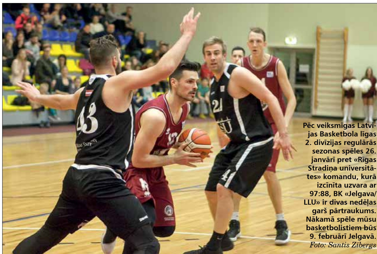
Pēc veiksmīgas Latvijas Basketbola līgas 2. divīzijas regulārās sezonas spēles 26. janvārī pret «Rīgas Stradiņa universitātes» komandu, kurā izcināta uzvara ar 97:88, BK «Jelgava/LLU» ir divas nedēļas garš pārtraukums. Nākamā spēle mūsu basketbolistiem būs 9. februārī Jelgavā.