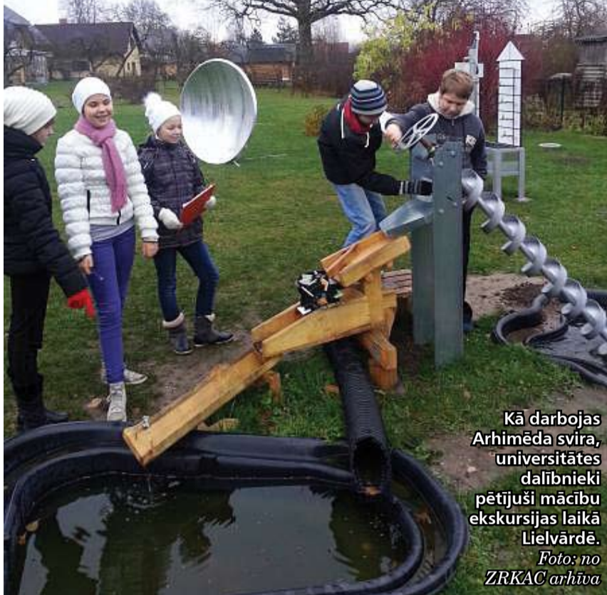
Kā darbojas Arhimēda svira, universitātes dalībnieki pētījuši mācību ekskursijas laikā Lielvārdē.

«Esam sapratuši: ja skolēns ir teicami fizikā, tas nebūt nenozīmē, ka viņam tā ļoti patīk un saista. Paši esam novērojuši, ka ne visiem bērniem, kurus skola iesaka JU, te patīk. Taču būtiski ir dot iespēju pamēģināt, lai saprot – patīk tas vai ne, nevis pieņemt vienu vai otru variantu bez mēģināšanas. Iespējams,