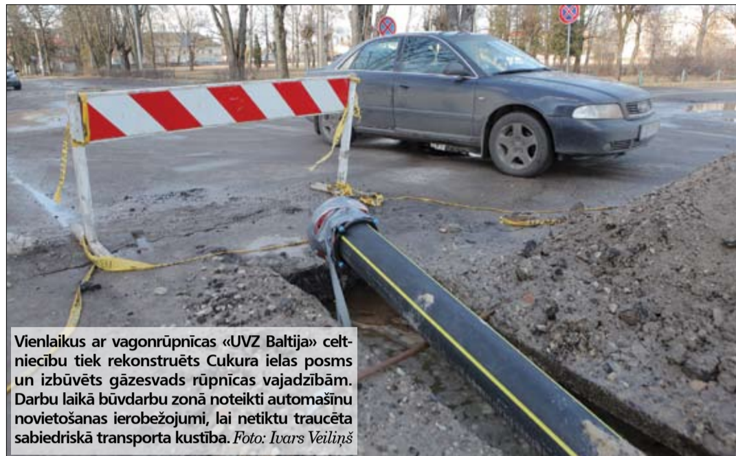
Vienlaikus ar vagonrūpnīcas «UVZ Baltija» celtniecību tiek rekonstruēts Cukura ielas posms un izbūvēts gāzesvads rūpnīcas vajadzībām. Darbu laikā būvdarbu zonā noteikti automašīnu novietošanas ierobežojumi, lai netiktu traucēta sabiedriskā transporta kustība.