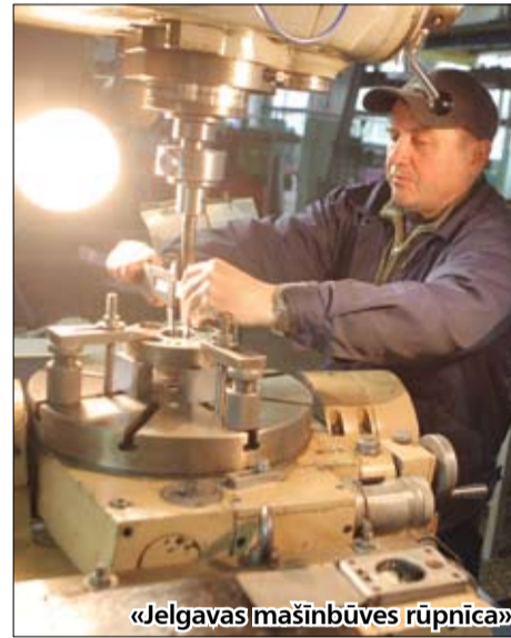
«Jelgavas mašīnbūves rūpnīca»