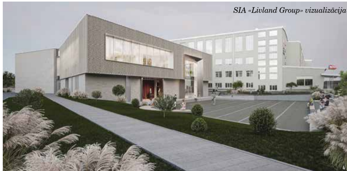
SIA «Livland Group» vizualizācija