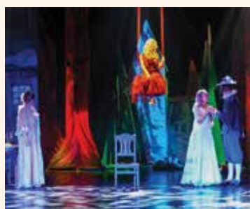
Pagājušajā gadā bērniem bija iespēja baudīt pasakas «Pelnrušķīte» uzvedumu.

Šogad bērnus priecēs izrāde «Ziemassvētku stāsts» pēc Čārlza Dikensa darba «Ziemassvētku dziesma prozā jeb Ziemassvētku spoku stāsts» motīviem, ko mazajiem jelgavniekiem rādīs Ādolfa Alunāna Jelgavas teātra aktieri Andra Bolmaņa režijā. «Caur stāsta galvenā varoņa Skrūdža piedzīvojumu izrāde vēsta par svarīgām vērtībām, par ko īpaši aizdomājami Ziemassvētku laikā, – labestību, līdzjūtību, palīdzību tuvākajiem un svētku radīšanas prieku. Šajā svētku gaidīšanas laikā notiks brīnumi, un pat mantkārīgais un skopais īgna Skrūdžs, kurš ieradīs domāt tikai par sevi, sapratīs, ka ir laiks