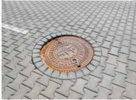
Bruģa iesēdums pie kanalizācijas akas Neretas ielas posmā