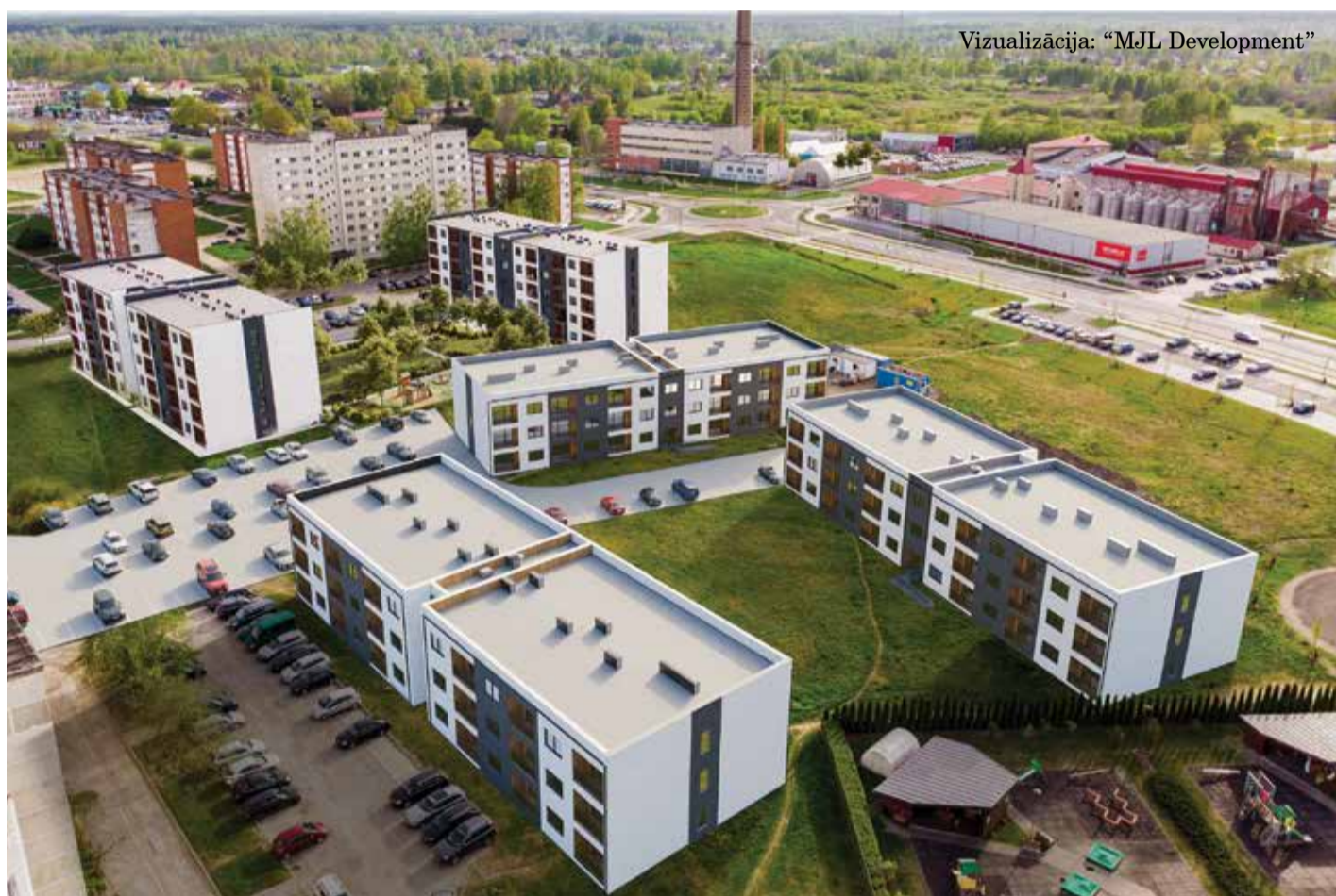
Vizualizācija: "MJL Development"

Ganību ielā 54 ir noslēgusies otrā zemas īres maksas nama būvniecība – māja nodota ekspluatācijā un dzīvokļi tajā jau tiek izīrēti. "MJL Development" grupā ietilpstošs uzņēmums SIA "Jelgavas Īres Nami" turpina projekta otrās kārtas attīstību, paredzot šajā teritorijā izbūvēt vēl trīs mājas ar 118 zemas īres maksas dzīvokļiem.