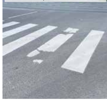
Horizontālais marķējums Malkas ceļā