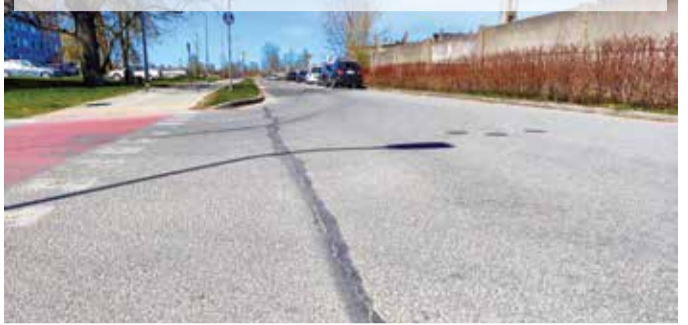
Neretas un Birzes ielu krustojums – šuve